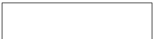
Схема границы эксплуатационной ответственности

Организация водопроводно- канализационного хозяйства